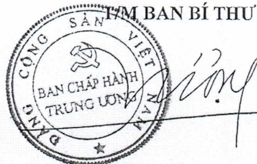
Trần Quốc Vượng